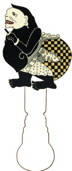
Semar Javaanse clown en schimfiguur uit Indonesië.