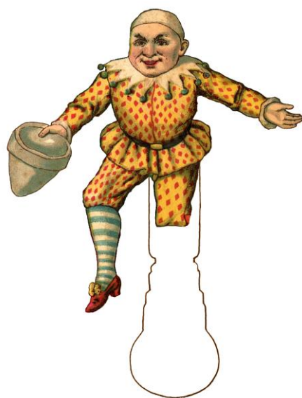
Amuseur public Internationaal. Clown. Papierentheaterfiguur.