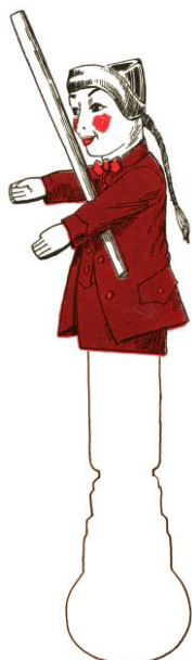
Guignol met een knuppel. Handpop uit Lyon.