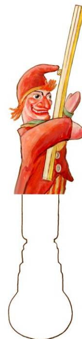
Jan Klaassen Oud-Hollandse handpop met een knuppel.