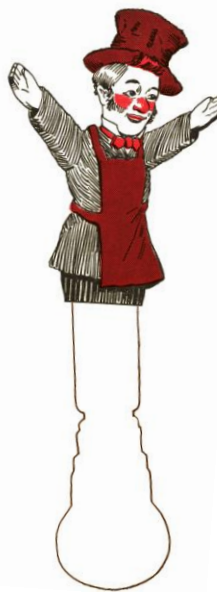
Gnafron Schoenmaker. Vriend van Guignol.