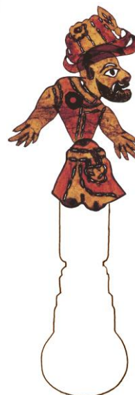
Karagöz Schimfiguur. Clown uit Turkije.