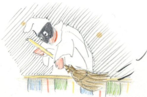
Afbeelding: Italiaanse stamvader van o.a. de oud-Hollandse Jan Klaassen. Hij draagt een zwart halfmasker. Zijn kostuum is wit en bestaat uit een wijd hemd, een wijde broek en een puntmuts waarvan de top meestal naar voren valt. Zijn rug is licht gebocheld. Illustratie: Hetty Paërl (Amsterdam, 1995).

De tentoonstellingen leggen uit waar Jan Klaassen en zijn vrouw Katrijn – en al hun buitenlandse vrienden en vriendinnen – vandaan komen. Wie is de zwartge-maskerde figuur die met zijn bezempje te keer gaat?