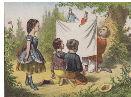
Afbeelding: detail centsprent. Serie 'Nieuwe Nederlandsche Kinderspeelen', nr. 52. Impressum: uitgeverij I. de Haan. Litho: Emrik en Binger (Haarlem, ± 1900). Collectie: Poppenspe(e)lmuseum.

Prenten en lesbrieven vertellen hoe jij de show kunt stelen. De multimediapresentatie Poppenspe(e)ltechnieken en -figuren geeft met plaatjes, filmpjes en korte teksten achtergrondinformatie over het (volks)poppenspel. Handig om te gebruiken voor een spreekbeurt of werkstuk. Kijk maar eens op http://www.poppenspelmuseumbibliotheek.nl/Techniek.html . Teksten en plaatjes zijn geplaatst binnen de gestileerde lijnen van een lijsttoneel. De presentatie is ook in printvorm beschikbaar. Woordraadsels, een (strip)verhaal, een masker, een tekening, vingerpopjes en een kleurplaat nodigen uit tot de activiteit 'Zelf eens proberen?' Losbladige set: map met 57 eenzijdig bedrukte pagina's, formaat A4, oblong.