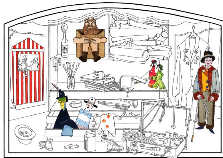
Afbeelding uit: Poppenspe(e)ltechnieken en -figuren, nr. 22 'Collectie'. Illustratie: Elsje Zwart © (Haarlem, 2010). Zie: http://www.poppenspelmuseumbibliotheek.nl/techniek/speel22.html .