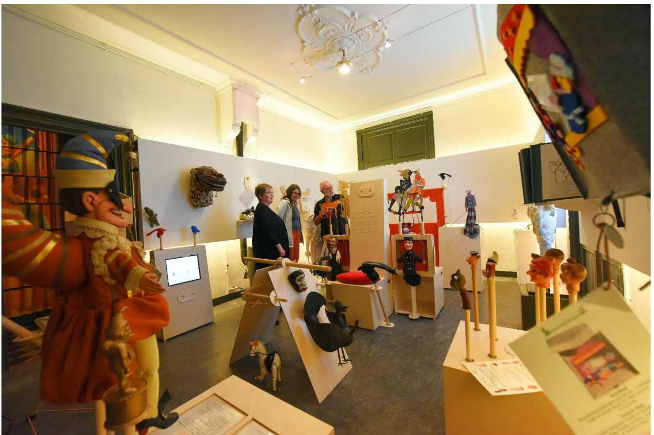
Afbeelding: sfeerbeeld expositie 'Een kijkje in de poppenkast'.

http://www.poppenspelmuseumbibliotheek.nl/blinden_EN.aspx .