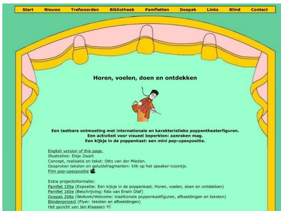
Afbeelding: websitepagina http://www.poppenspelmuseumbibliotheek.nl/blinden.aspx .

De POPMUS-websites en de thema-exposities hangen zeer nauw samen. Ze geven door middel van diverse invalshoeken informatie over de poppenspeltechnieken, verschijningsvormen en de historie van het internationale poppen-, figuren- en objecttheater. De website-informatie, de exposities en de begeleidende teksten zijn bijna altijd in het Nederlands, Duits en het Engels.